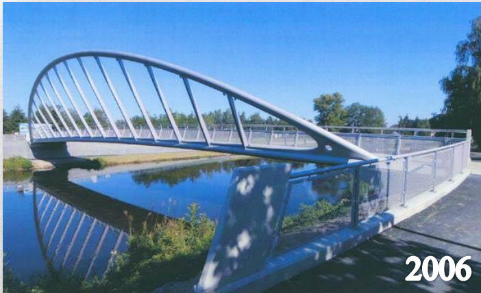
Lávka přes Vltavu České Budějovice

Změna využití vodárenské věže na penzion Nový Bohumín