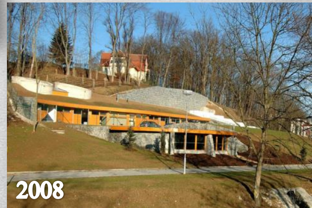
Čistírna odpadních vod Náměšť nad Oslavou