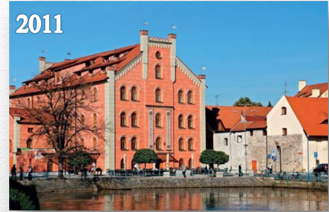
Rekonstrukce Předního mlýna na hotel České Budějovice