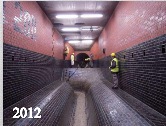
Koncová odlehčovací komora kmenové stoky „C“ Praha–Bubeneč