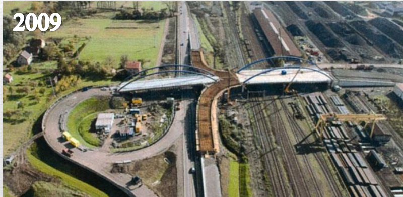
Mosty na mimoúrovňovém napojení průmyslové zóny Třinec–Baliny