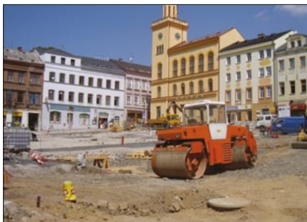
Dolní náměstí během rekonstrukce