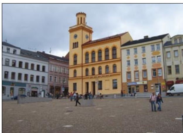
Dolní náměstí po rekonstrukci