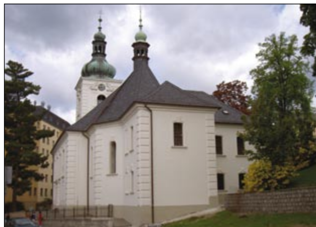
Kostel sv. Anny po rekonstrukci

Jablonec nad Nisou – k jeho převodu došlo v roce 2005. V posledních dvaceti letech byl až na výjimky uzavřen. Jeho obnovou tak vznikl reprezentativní kulturní stánek, ve kterém se konají koncerty a výstavy. Partnery projektu jsou organizace města, a to Eurocentrum Jablonec n. N., s. r. o., Městská knihovna a Městské divadlo, o. p. s., které garantuje programovou nabídku v kostele.