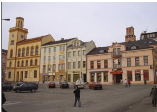
Dolní náměstí – stav před rekonstrukcí