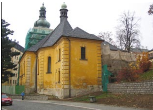
Kostel sv. Anny před rekonstrukcí, pohled z ulice Soukenná