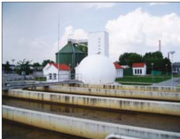
Obr. 1: Projekt Břeclavsko

06/2006 – 12/2008) s celkovými náklady 47,3 mil. EUR (37,4 mil. EUR tvoří podpora z FS), který řeší rekonstrukci a výstavbu stokových sítí a čističek odpadních vod v devíti aglomeracích okresu Břeclav.