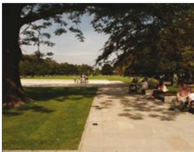
Obr. 3: Součástí zájmu Evropské úmluvy o krajině je i krajina sídel (lázeňský park v Poděbradech)

Vyhodnotit výsledky Státního programu ochrany přírody a krajiny ČR a obdobných programů a ve vazbě na přijatý návrh krajinné politiky připravit Státní program odpovědnosti za krajinu, definující prioritní úkoly v oblasti ochrany, správy a plánování krajiny. Program přiměřeným způsobem promítnout do dalších resortních