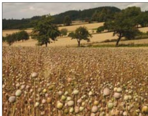
Obr. 2: Krajina Žďárských vrchů odráží na mnoha místech stopy tradiční zemědělské kultivace vrchovin, které je třeba udržet (Jimramovsko)