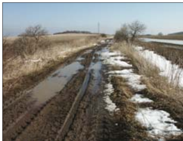
Obr. 5: Odcizení a nezájem uživatelů o krajinu vyžaduje změnu přístupu (Radonicko)