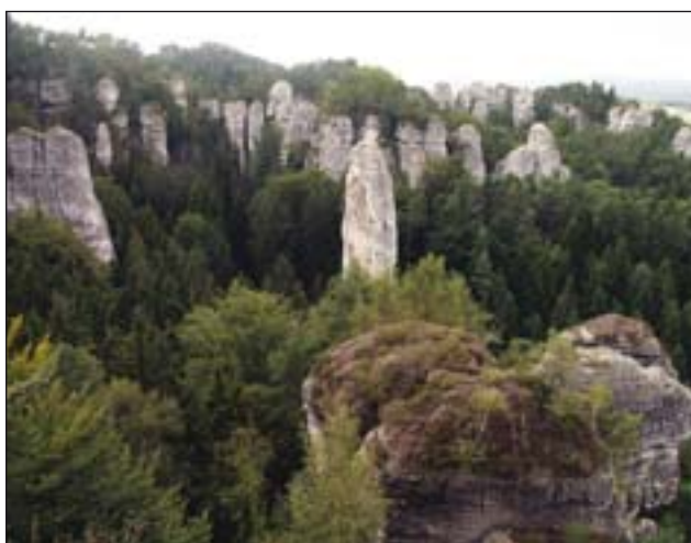
Obr. 1: Jedinečná krajina Českého ráje je nejenom naší nejstarší chráněnou krajinnou oblastí, ale i 25. evropským geoparkem UNESCO (Hruboskalsko)