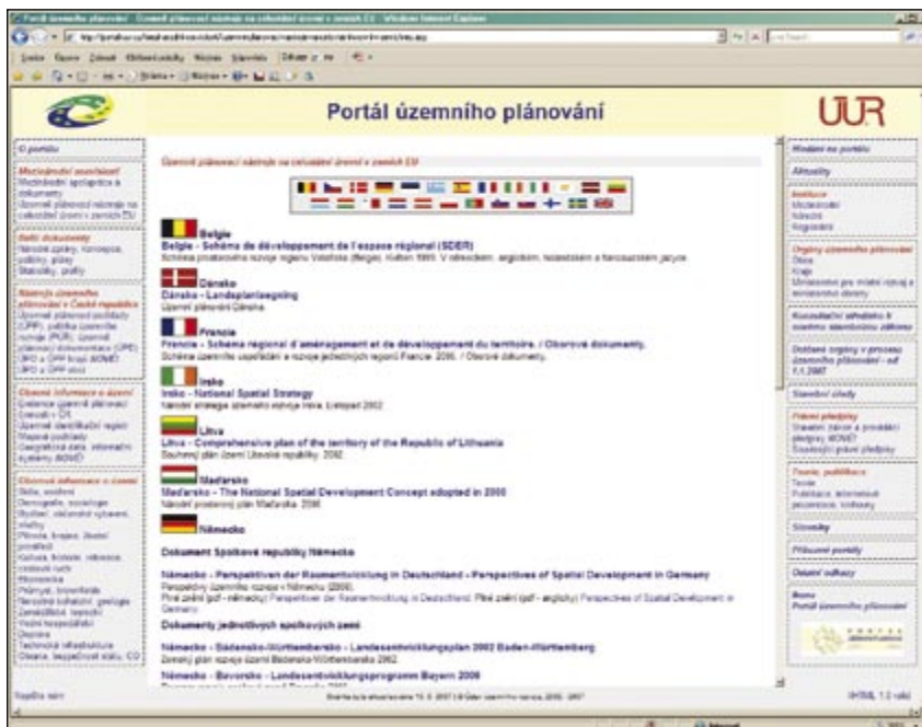
Obr. 1: Územně plánovací nástroje na celostátní úrovni v zemích EU

Na Portálu ÚP dochází k neustálému procesu provozu, údržby a rozvoje databáze a k průběžnému doplňování odkazů ve všech kategoriích. Na konci roku 2006 a v první polovině roku 2007 došlo na Portálu ÚP ke změnám v souvislosti s účinností nových právních předpisů (Stavební zákon a prováděcí vyhlášky) od 1. 1. 2007. V této souvislosti byla také upravena struktura levého a pravého menu, doplněny a změněny názvy některých vstupních