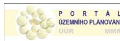
Obr. 5: Ikona Portál územního plánování

V této kategorii odkazů lze nalézt všeobecné informace o nástrojích