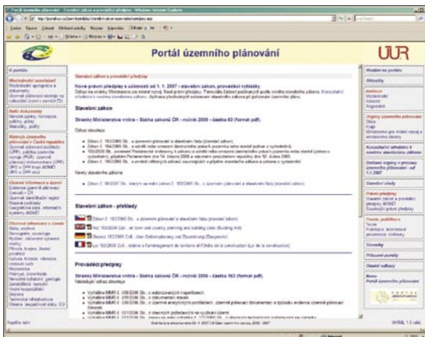
Obr. 4: Právní předpisy

umožněno hledání přímo v jednotlivých tématech.