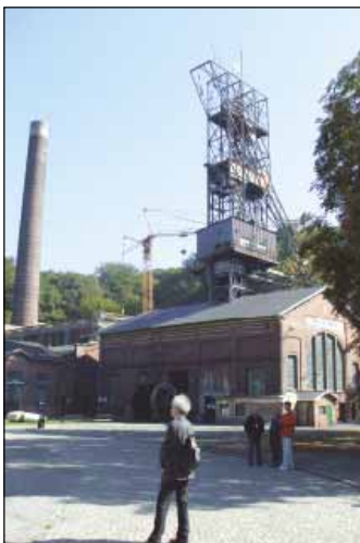
Těžní věž NKP Důl Michal