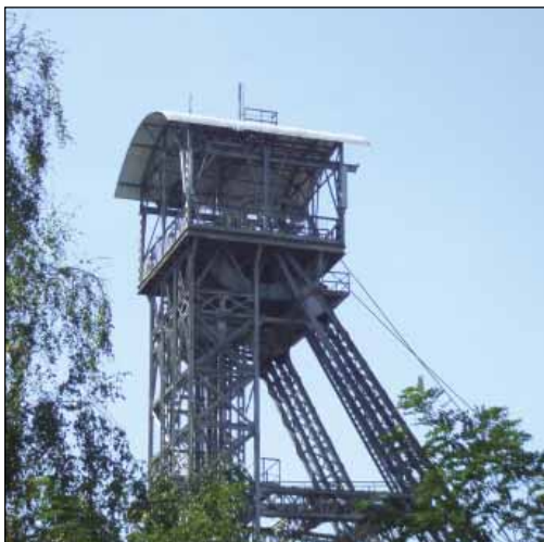
Těžní budova Dolu Eduard Urx - areál hornického muzea