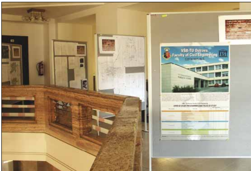
Výstava studentských prací byla instalována na osmi panelech a umístěna do veřejného komunikačního prostoru čtvrtého nadzemního podlaží Nové radnice

7 je již zaniklých. Informace o nich lze najít v historických nebo odborných publikacích nebo v materiálech archivu města Ostravy. Dílo by mělo plnit funkci alternativního průvodce a mělo by sloužit široké veřejnosti k identifikaci a prezentaci technických památek na území města a zároveň jako námět a inspirace pro novou oblast turistiky.