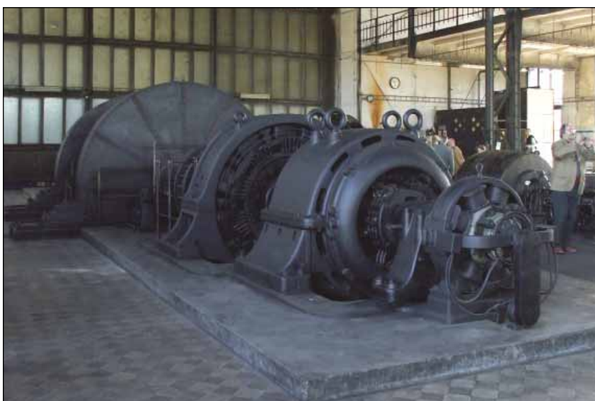
Dochované zařízení na Dole Michal

Bienále bylo i v Ostravě doprovázeno mnoha doprovodnými akcemi. Některé začaly již před samotným bienále a trvaly do jeho ukončení, jiné akce – především výstavy – trvaly ještě i po ukončení bienále. Pro informaci uvádíme některé akce: