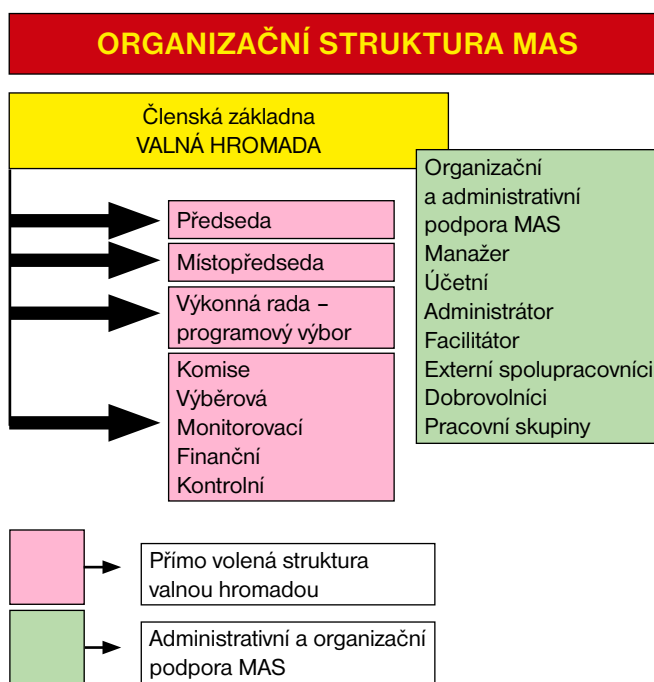
Organizační struktura MAS Kyjovské Slovácko v pohybu

Kyjovské Slovácko k výraznému rozvoji lidských zdrojů a budování nových kapacit (vznik devíti nových nestátních neziskových organizací). Na základě programu došlo ke vzniku nových partnerství, ale také nových