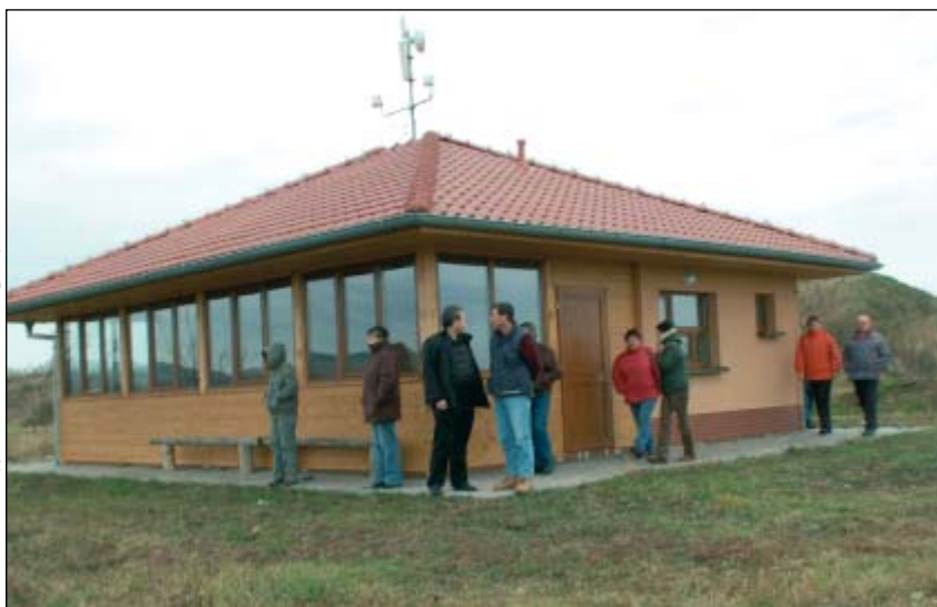
Zázemí pro lyžařský vlek v Uhřicích (financováno z programu LEADER)

jí na různých konferencích o venkově a v posledních dvou letech připravili společnou prezentaci i na výstavě Země živitelka v Českých Budějovicích. V současné době připravují první projekt Spolupráce v rámci Opatření IV 2.1. Programu rozvoje venkova ČR.