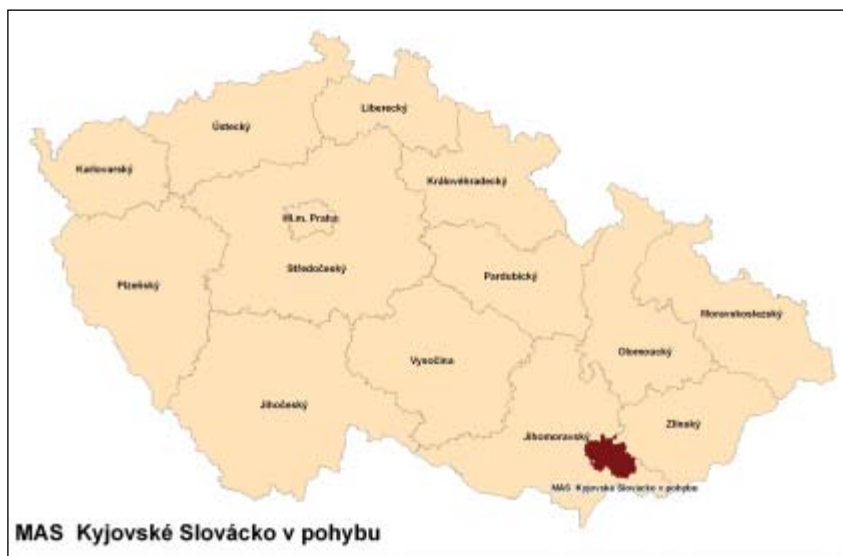
Vymezení MAS Kyjovské Slovácko v pohybu v rámci Jihomoravského kraje i ČR