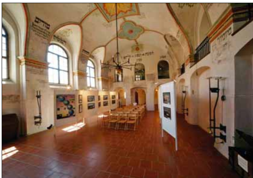
Renovovaný interiér zadní synagogy

Vzhledem ke skutečnosti, že historie židovské komunity v Třebíči prakticky skončila krátce po II. světové válce, neboť z více než tři set Židů odvečených do koncentračních táborů se vrátilo jen 10 lidí, nemohla již zrekonstruovaná synagoga sloužit náboženským účelům, ale bylo třeba nalézt