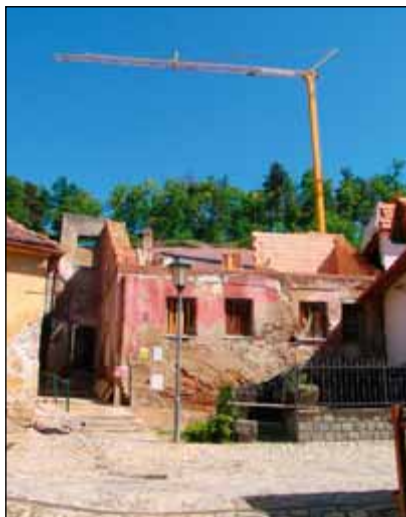
Probíhající rekonstrukce objektu v židovské čtvrti

vovy ulice, poblíž vstupu do židovské čtvrti ze Žerotínova náměstí. Technická a finanční nákladnost rekonstrukce výrazně omezila okruh potenciálních investorů. Naštěstí se tohoto nelehkého úkolu ujala místní soukromá stavební firma a oba zchátralé domy téměř desetimilionovým nákladem přebudovala na své firemní sídlo. Přestože náplň obou funkčně propojených objektů je navýsost soudobá (sídlo firmy, projekční oddělení, prodej kopírek, internetová minikavárna, reprezentační prostory...), stavební obnova v zásadě nejen respektuje hmotové řešení objektu a jeho vnější vzhled, ale podařilo se uchovat i cenné interiérové prvky včetně kleneb, původních trámových stropů a ve sklepě dokonce rituální lázně – mikve. Právě kontrast soudobého obsahu a respektu ke starým prostorům dává vzniknout nové kvalitě.