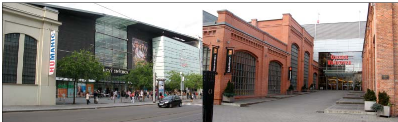
Obr. 6: Nákupní centrum Nový Smíchov v Praze a Galerie Vaňkovka v Brně

Pozn.: V popředí levého snímku je vidět část původní budovy Ringhofferových závodů, později Tatrov Smíchov. Na pravém snímku restaurovaná část původní slévárny a strojírna Friedrich Wannick, později Zetor Brno.