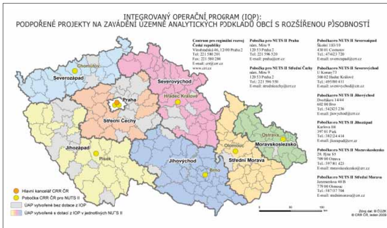
Kartogram 1: Podpořené projekty na zavádění ÚAP obcí s rozšířenou působností