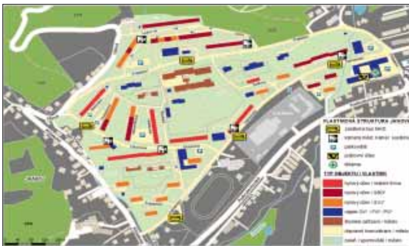
Obr. 2: Vlastnická struktura sídliště Janov

*SBD – stavební bytové družstvo; SVJ – společenství vlastníků jednotek; OV – občanská vybavenost; FO – fyzická osoba; PO – právnická osoba