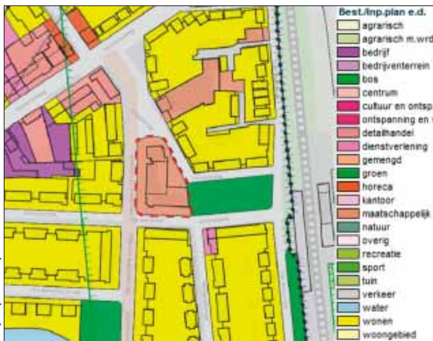
Obr. 3: Výřez územního plánu při zónování ulice „Van Voorst tot Voorst“ ve městě Vught

sídly. Obce mají podobné pravomoci, ale autonomie obce je podřízena provinčním a národním politikám územního rozvoje. Podle zákona obce vypracovávají místní plány a politiky územního rozvoje. Zároveň na základě nařízení obce musí implementovat požadavky speciálních politik územního rozvoje národního nebo provinčního významu. Pro realizaci národních cílů územního plánování na provinční a lokální úrovni jsou důležité finanční prostředky měst a regionů.