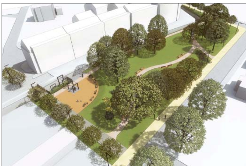
Územní studie Hradec Králové – vizualizace parku

Titul Urbanistický projekt roku 2013 byl udělen zejména za hloubku a reálnost zpracování obou parků jako veřejného prostoru.