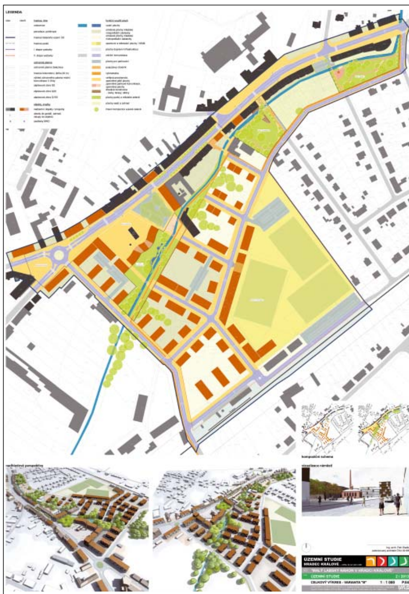
Územní studie Hradec Králové – celkový výkres (varianta B)