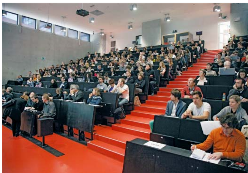
Konference se uskutečnila na Fakultě architektury ČVUT v Praze