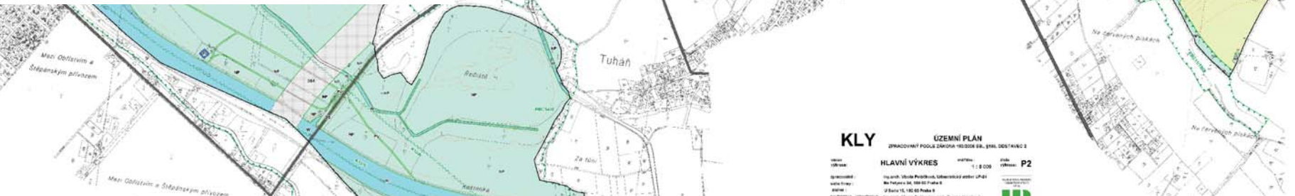
Ilustrativní příklad hlavního výkresu územního plánu (obec Kly)

Význam indolů funkcí zastoupených v plochách smíšených nezastavěného území: pr - přírodní zp - zemědělská in - lesnická vn - vodohospodářská rr - rekreační neprofitová pz1 - sady a vinice