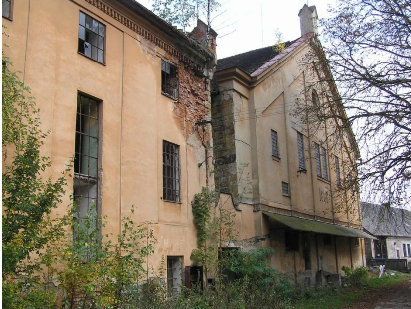
Pivovar Choustníkovo Hradiště