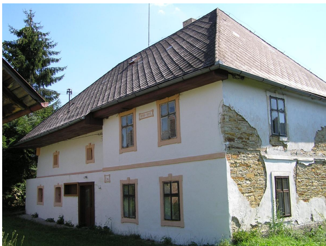
Mlýn Borovnice - Přestavlky