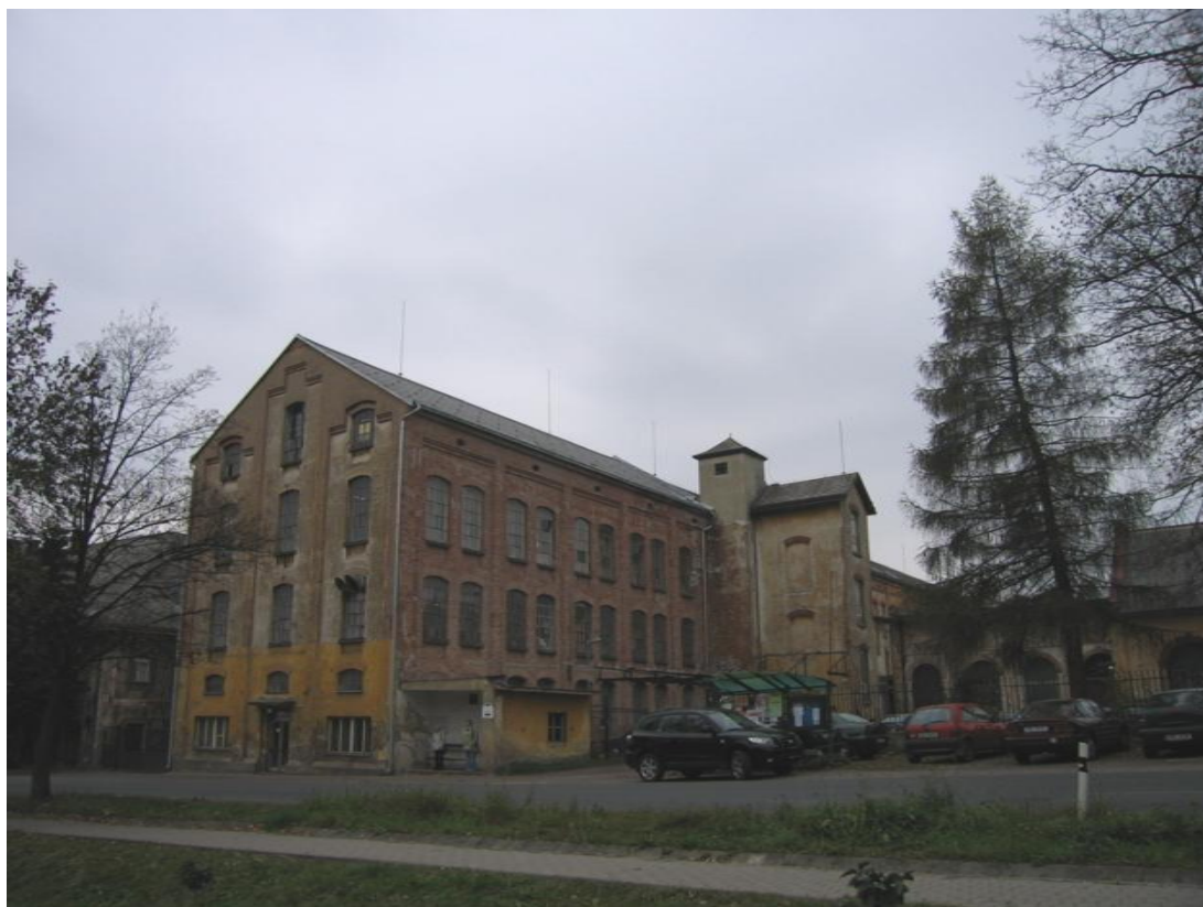
Továrna na hedvábné zboží J. A. Valero Kocbeře