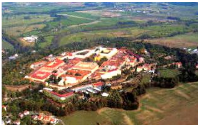
Pevnost Josefov pevnostjosefov.wz.cz