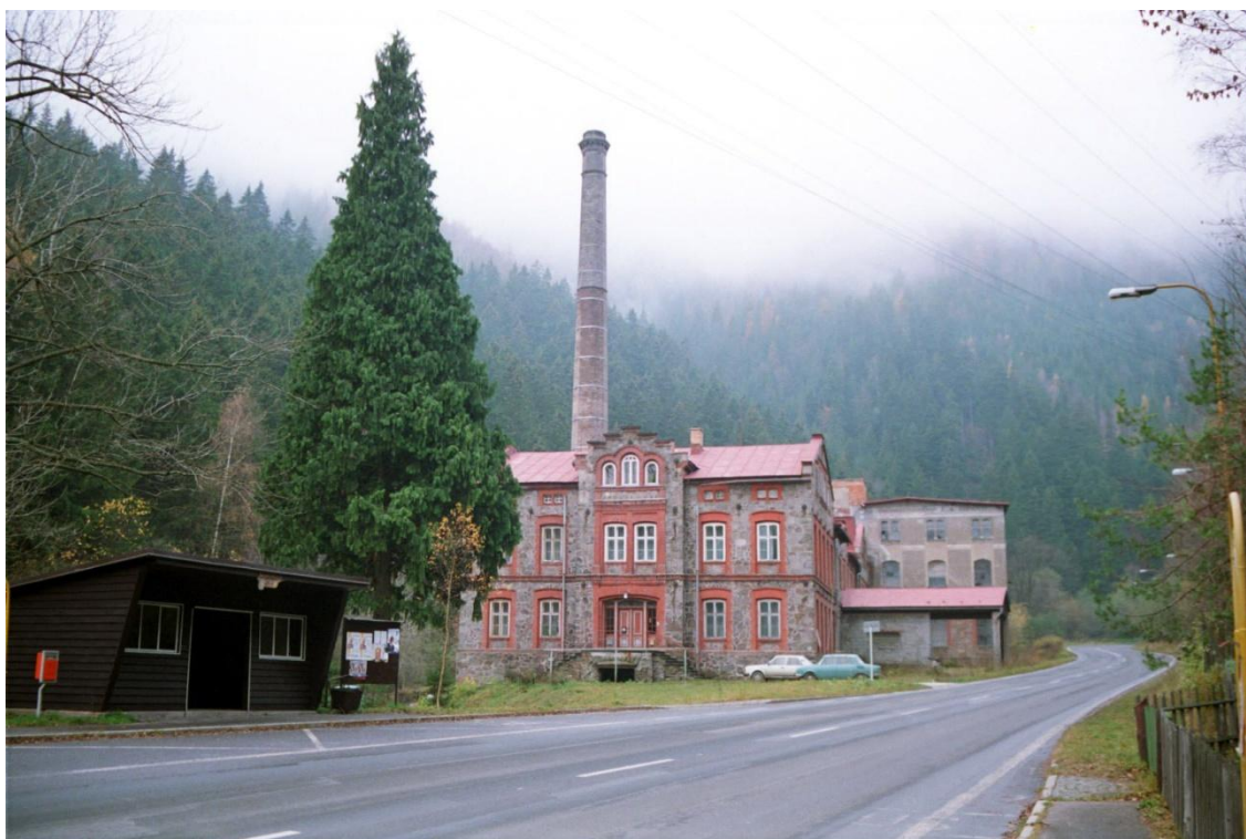
Brusárna dřeva Horní Maršov – Temný Důl