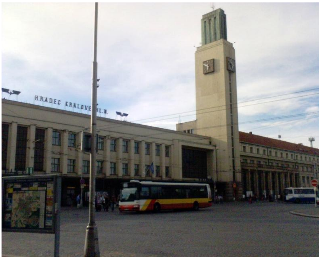
Hlavní nádraží Hradec Králové cs.wikipedia.org/wiki/Hradec_Králové - 123k