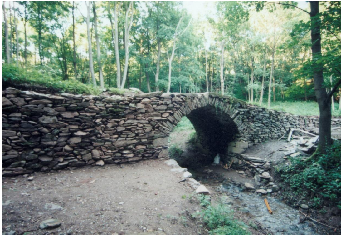
Středověký most Sklenařovice