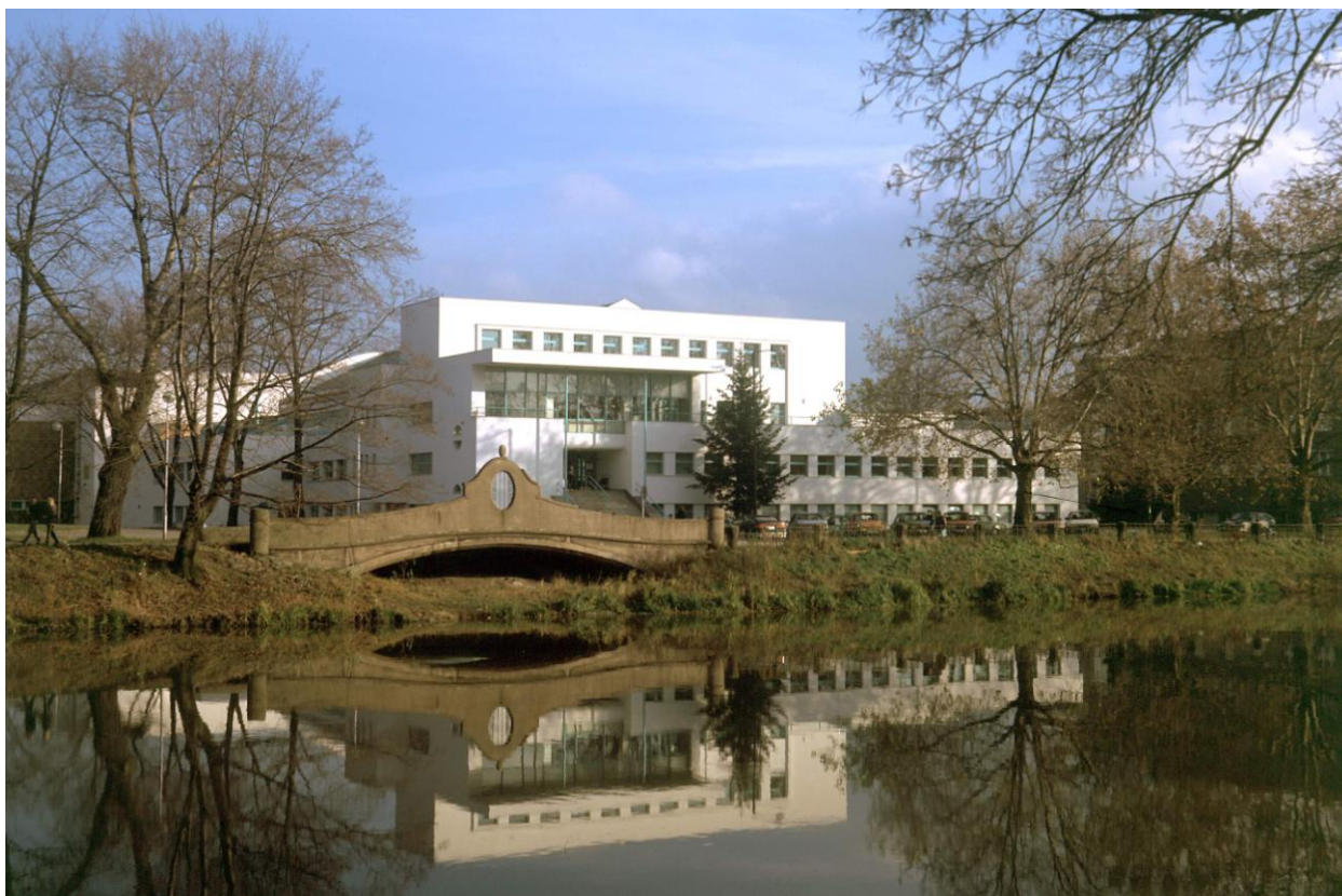
Aquacentrum Hradec Králové