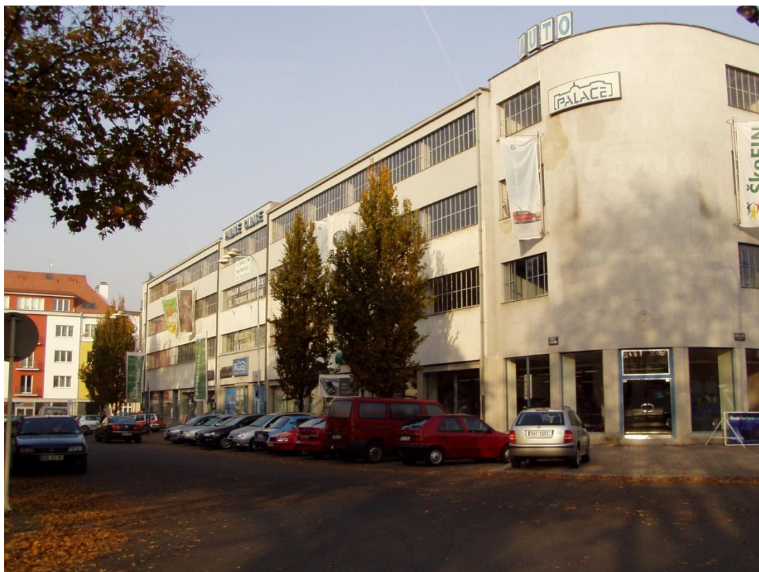
Garáže Hradec Králové