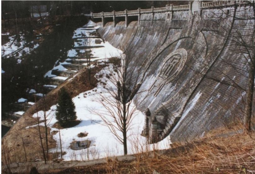
Přehrada Labská Špindlerův mlýn