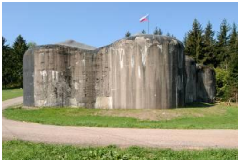
Pevnost Stachelberg Žacléř – Babí www.trutnov.cz