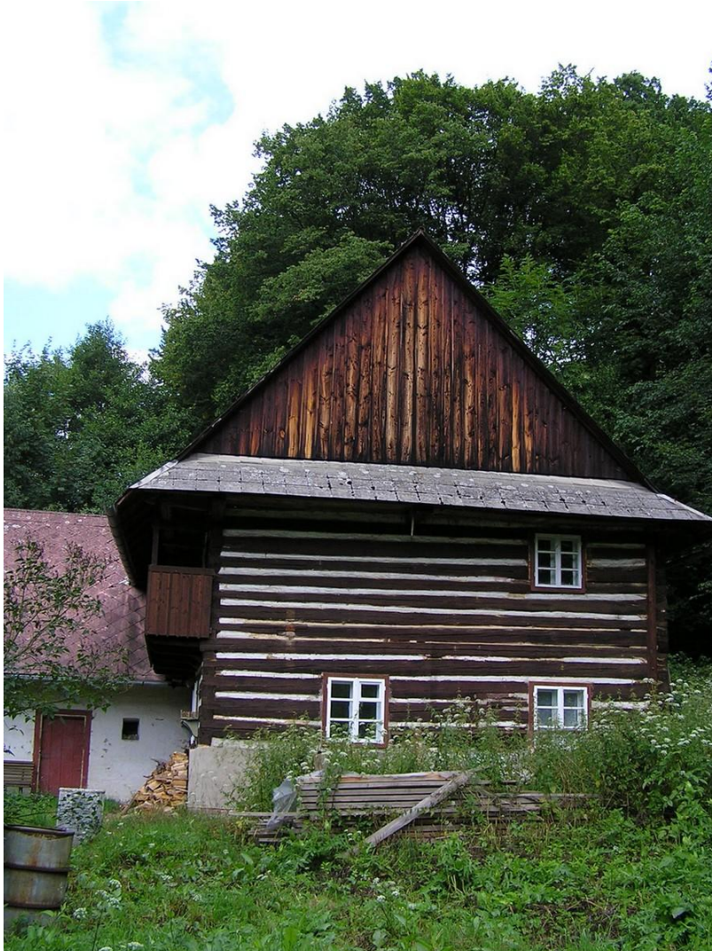
Vodní mlýn Val