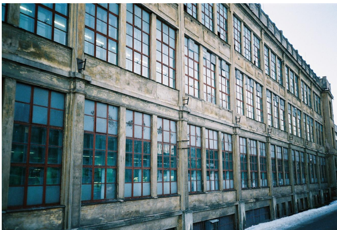
Velveta Nová Paka