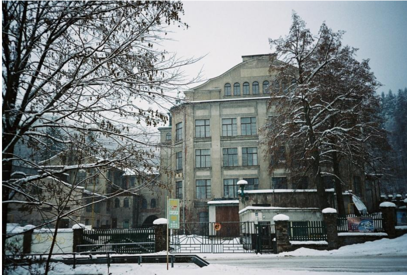
Textilka Černý Důl