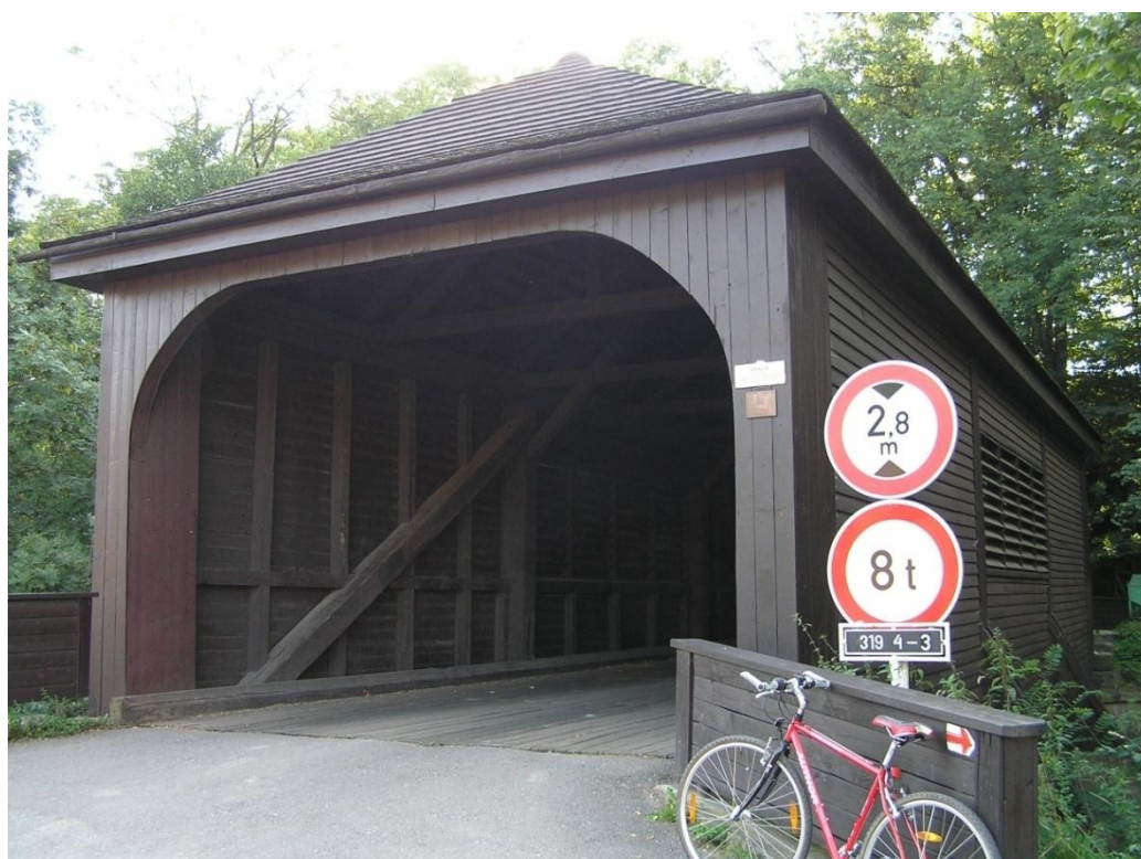
Krytý most Peklo nad Zdobicí