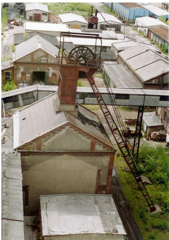
Důl Jan Šverma Žaclěř