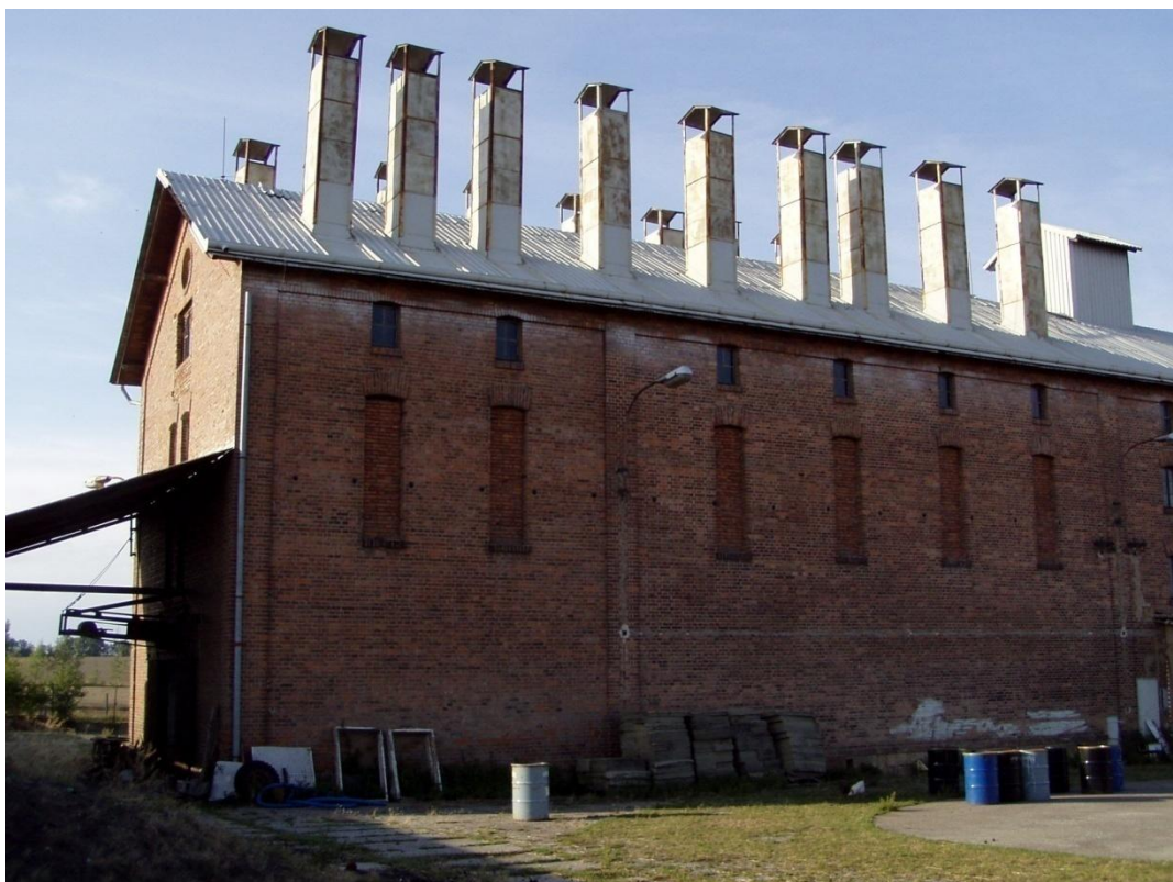
Sušárna čekanky Bydžovská Lhota