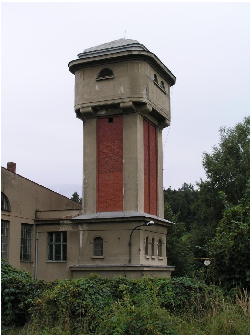
Plátenická manufaktura Potštejn