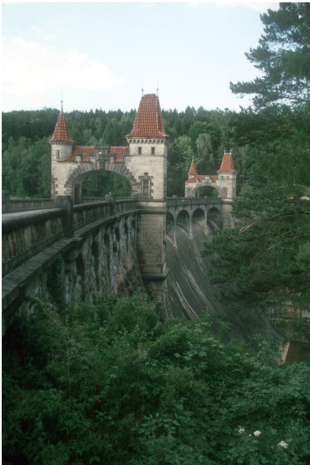
Přebuda Les Bílá Třemešná