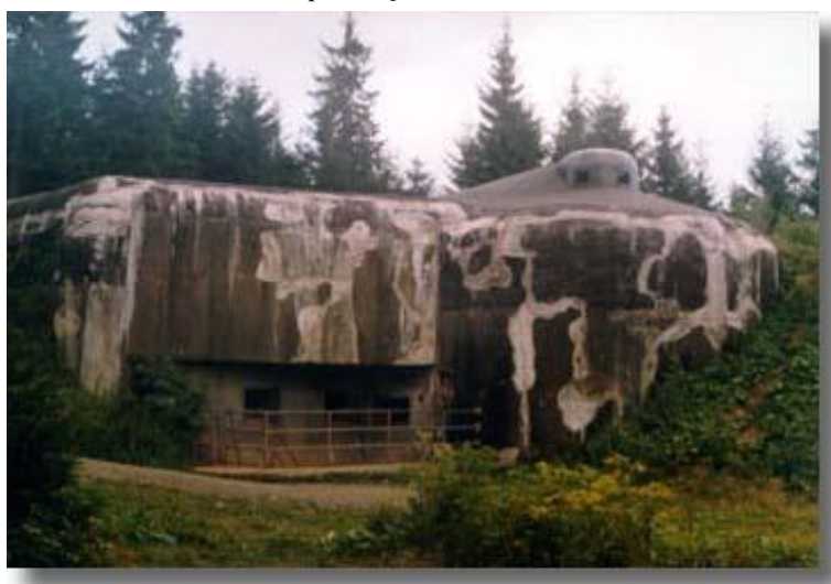
Pevnost Hanička www.hanicka.cz