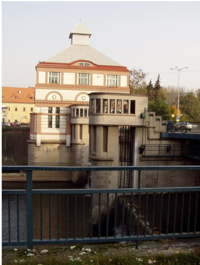
Elektrárna Labská Hradec Králové