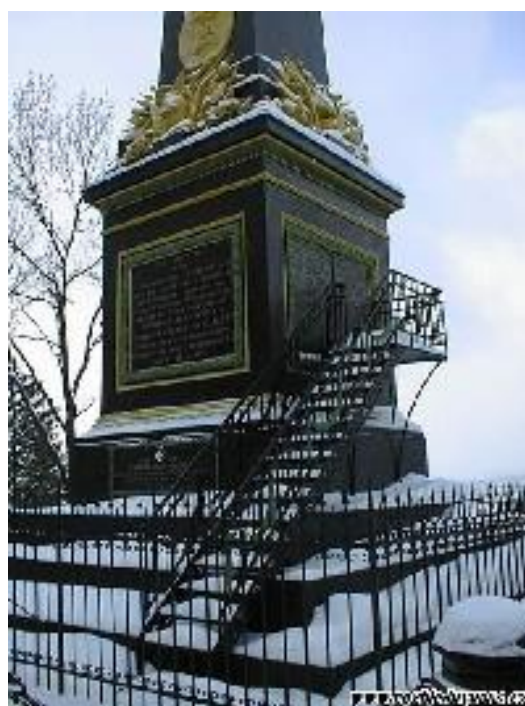
Litinový monument Trutnov www.rozhlednyunas.cz