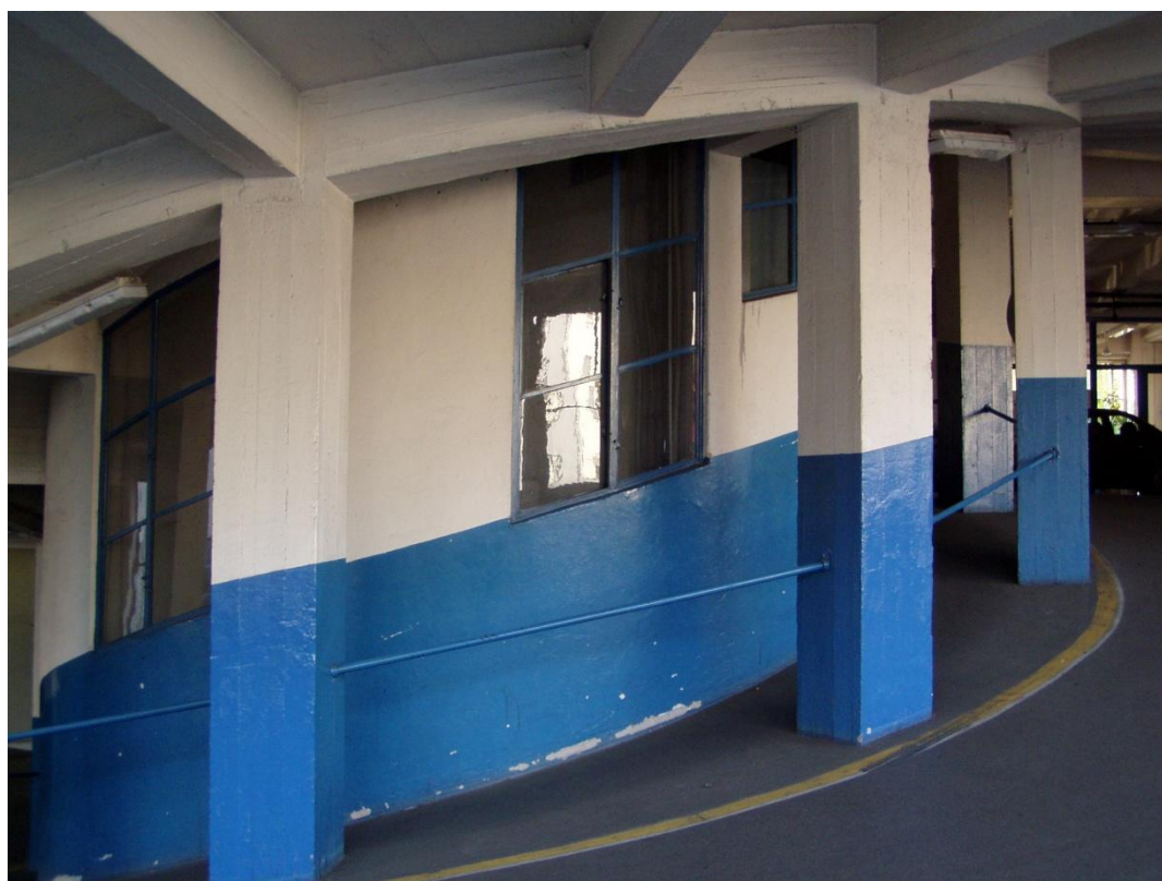
Garáže Hradec Králové