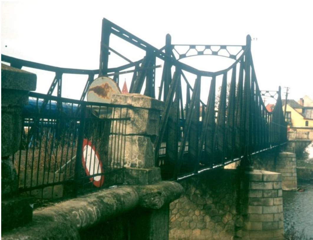
Silniční most Kostelany nad Moravou