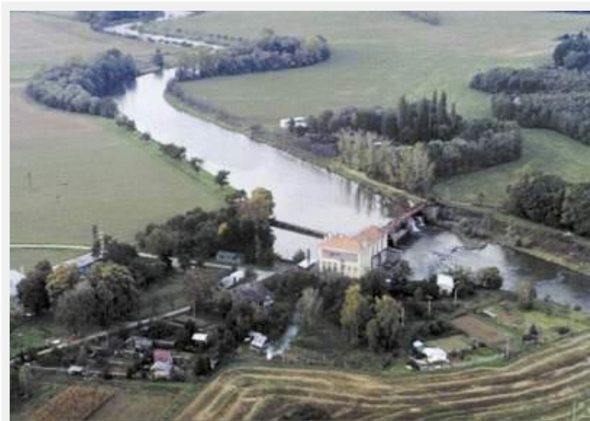
Vodní elektrárna Na Strži Kroměříž www.kromerizsko.cz/detail_foto.asp?id=09 - 14k -