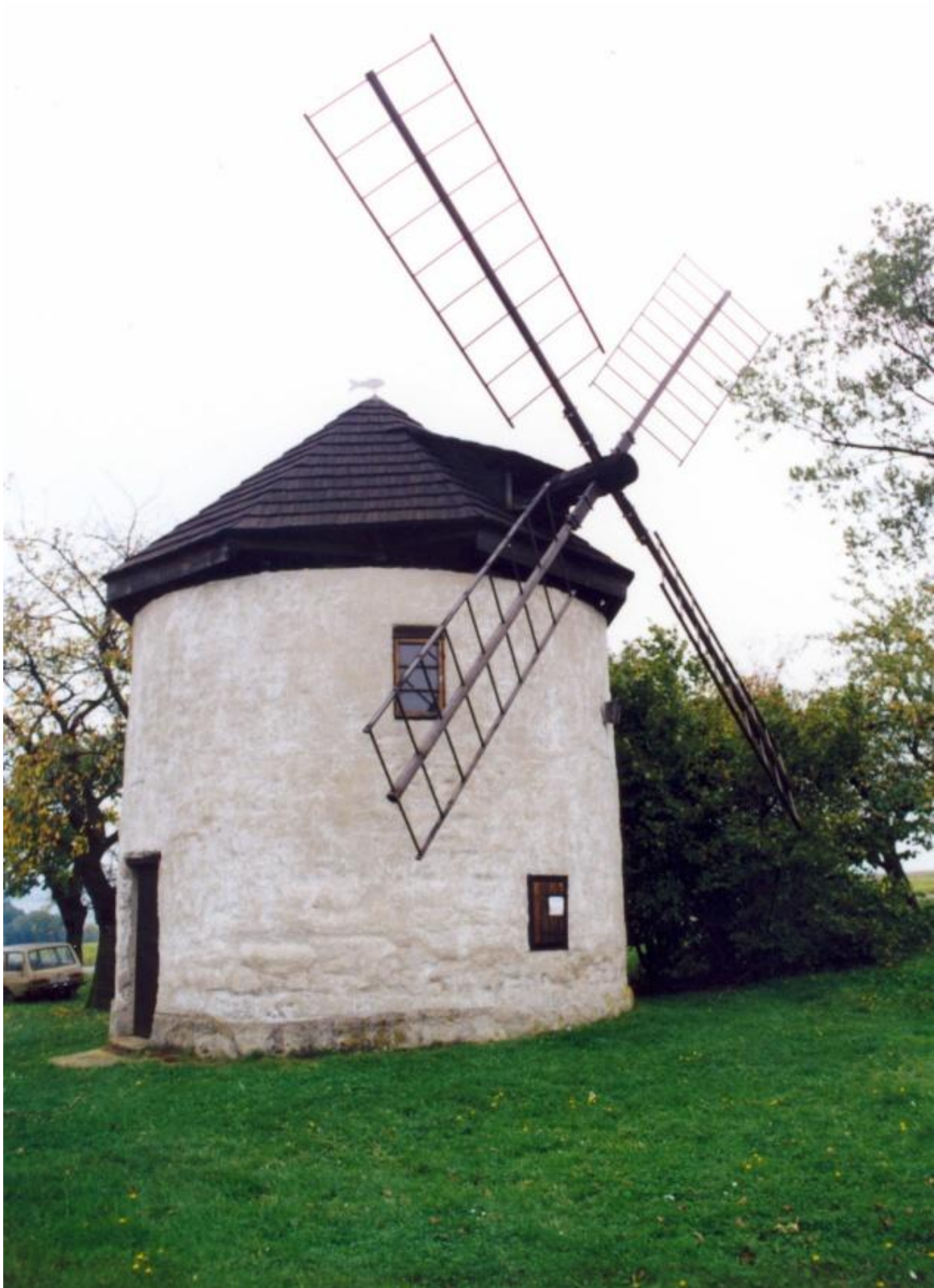
Větrný mlýn Štípa