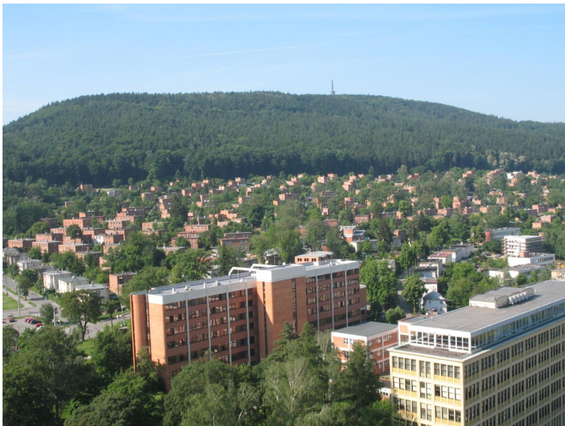
Bařovy závody Zlín