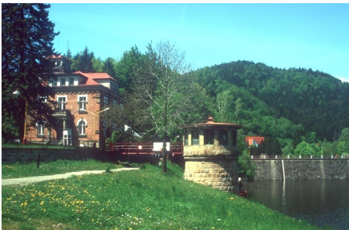
Vodní nádrž Bystřička