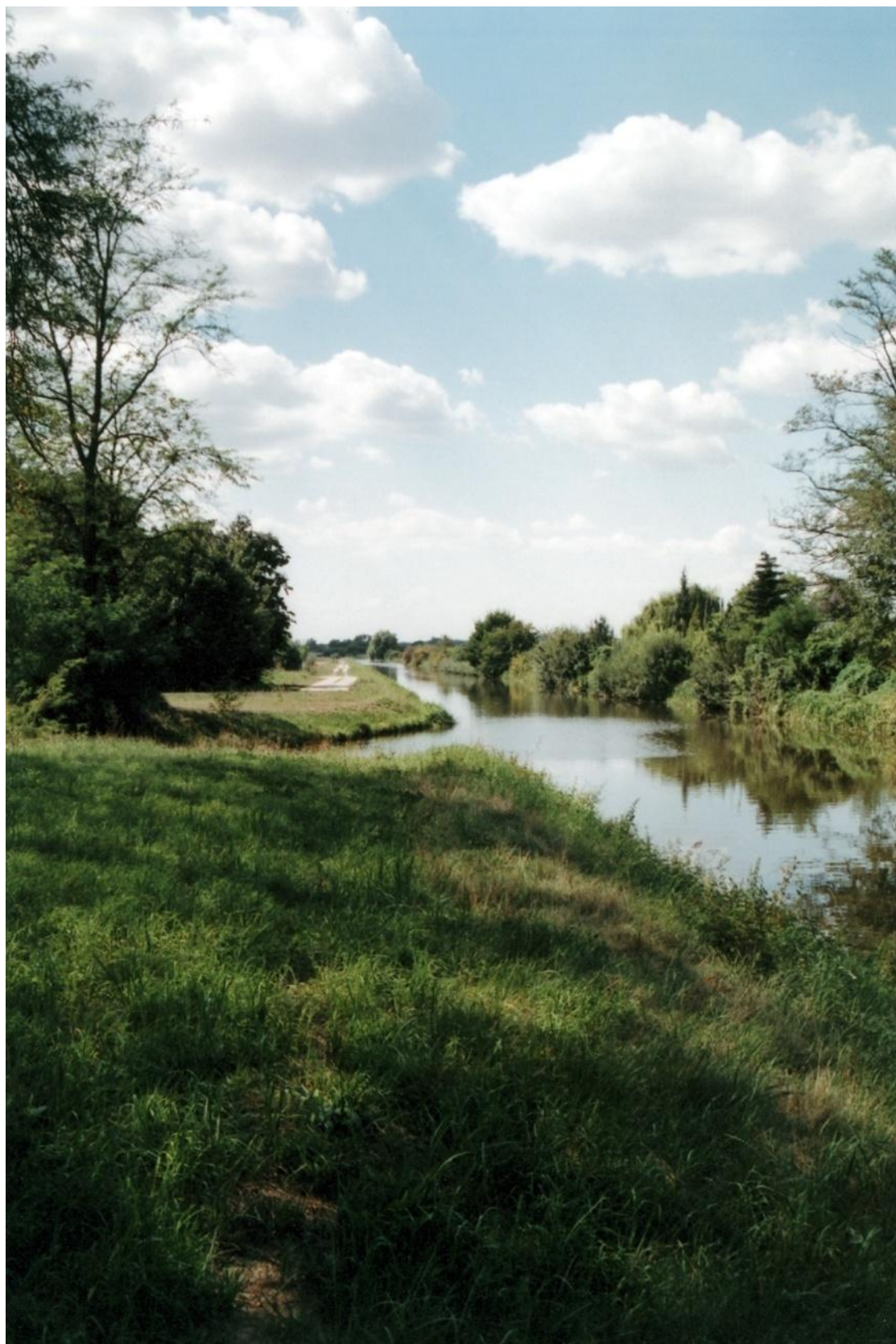
Bařův kanál Otrokovice