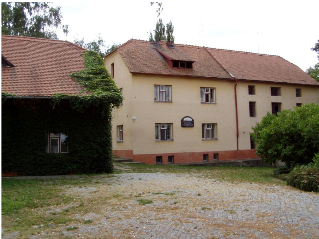
Bártkův mlýn Nivnice