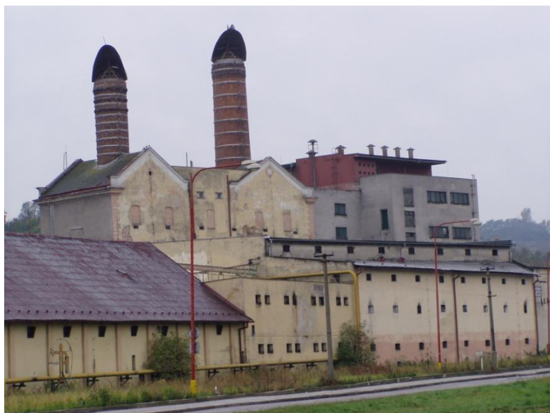
Pivovar Uherské Hradiště – Jarošov