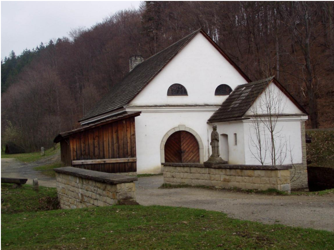
Valašské muzeum v přírodě, Mlýnská dolina Rožnov pod Radhoštěm