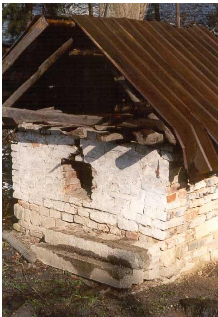
Chlebová pec Brumov – Bylnice www.brumov-bylnice.cz