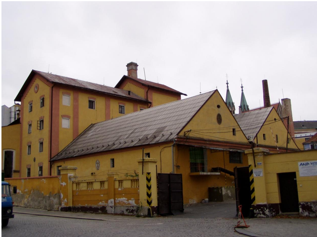
Arcibiskupský pivovar Kroměříž