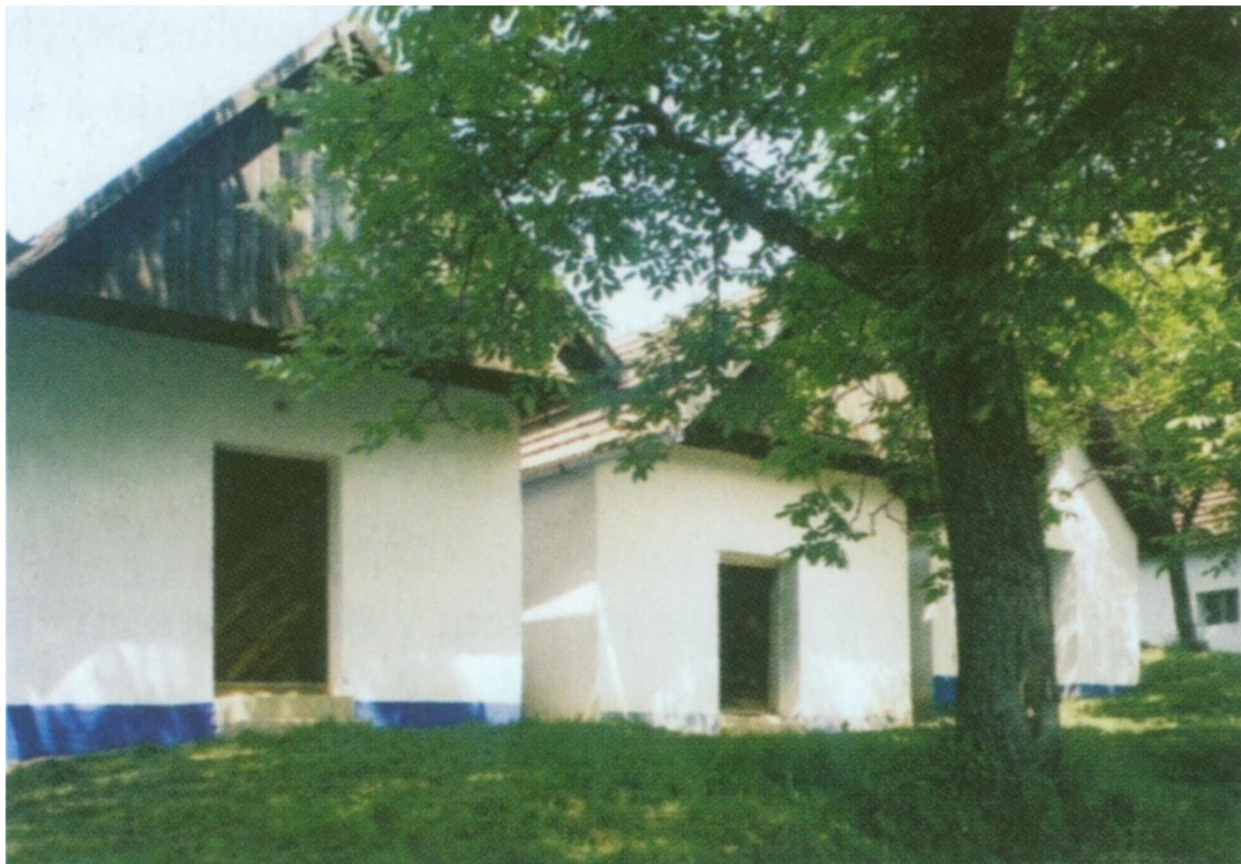
Vinné sklípky Vlčnov