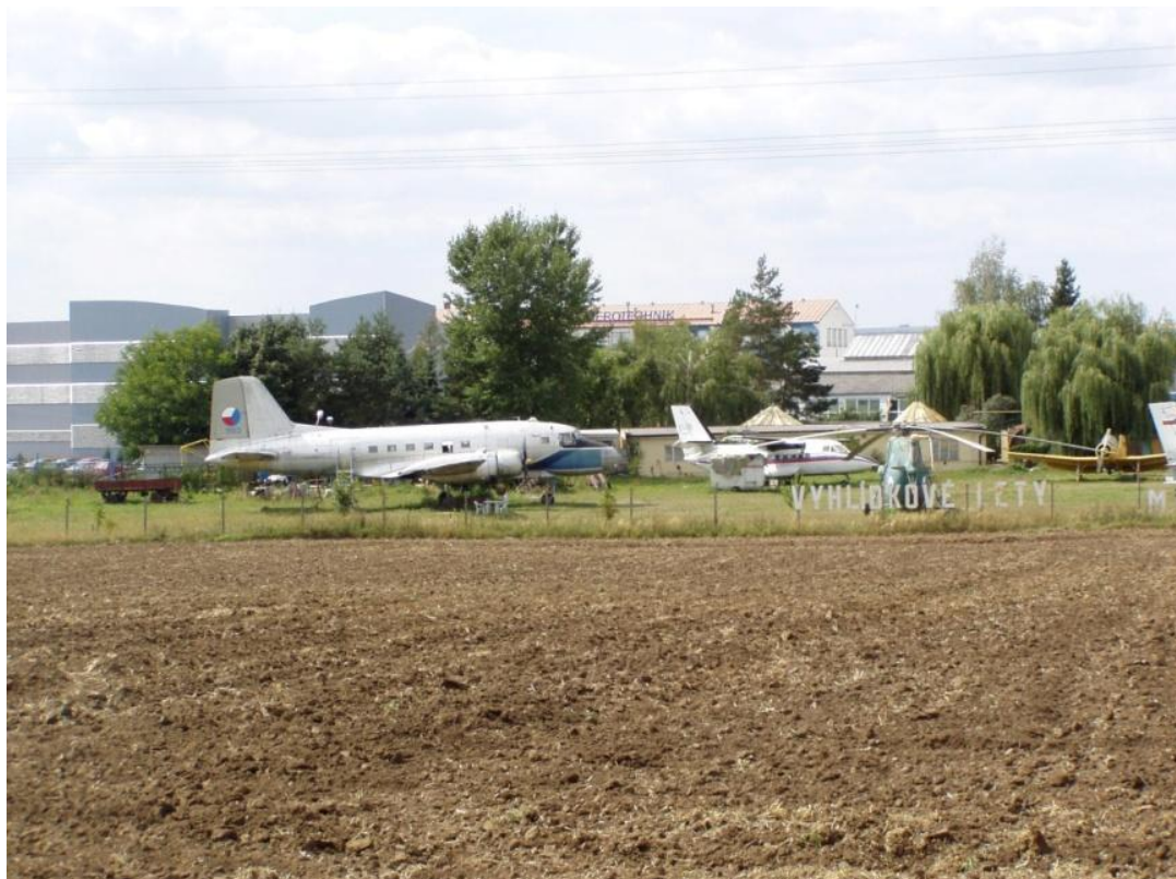
Letecké muzeum Kunovice