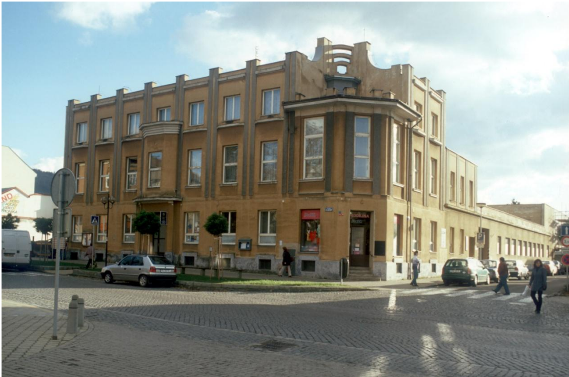
Bystřice pod Hostýnem